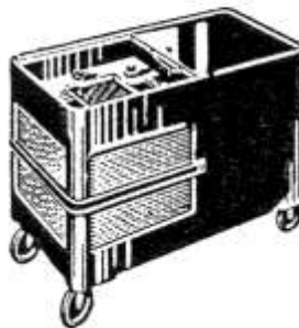
Sessel-Phonosuper 3976 WKS