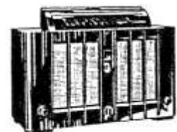
T 8001 WK/GWK