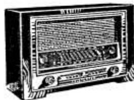
D 760 WK

054 GWK 054 BK 065 WK Spezialsuper 065 GWK Spezialsuper 076 WK Großsuper 076 GWK Großsuper D 707 WKK