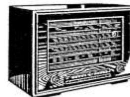
D 860 EK/WKZ

1941: TELEFUNKEN geht in den alleinigen Besitz von AEG über (siehe dazu Museums-Bote Nr. 9).