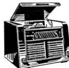
Phono 3975 WKS/GWKS