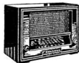
D 750 WK/GWK