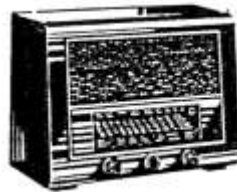
T 865 BK

T 813 W T 813 GW T 855 W Markstein II T 855 GW Markstein II T 865 BK T 875 WK Zeesen T 875 GWK Zeesen T 875 WKS Phono T 875 GWKS Phono T 876 WK Großsuper T 876 GWK Großsuper T 876 WKAS Sessel-Phonosuper T 876 WKA Sessel-Super T 898 WK Spitzensuper T 898 WKZ Spitzensuper T 8000 GWK Spitzensuper T 8001 WK Spitzensuper T 3877 Autosuper